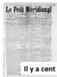
Il y a cent ans...